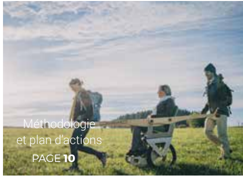
Méthodologie et plan d'actions