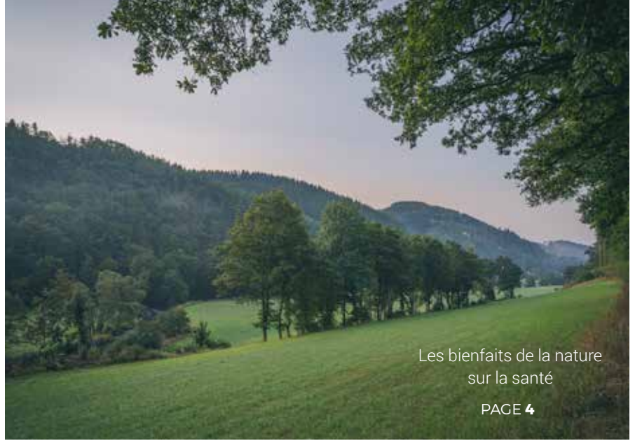
Les bienfaits de la nature sur la santé