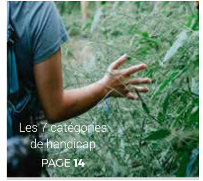
Les 7 catégories de handicap