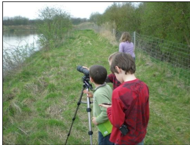
Réalisation de stages et d'ateliers et d'activités extrascolaires