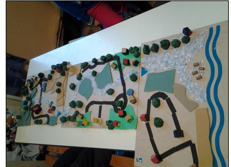
Création de jeux et de films