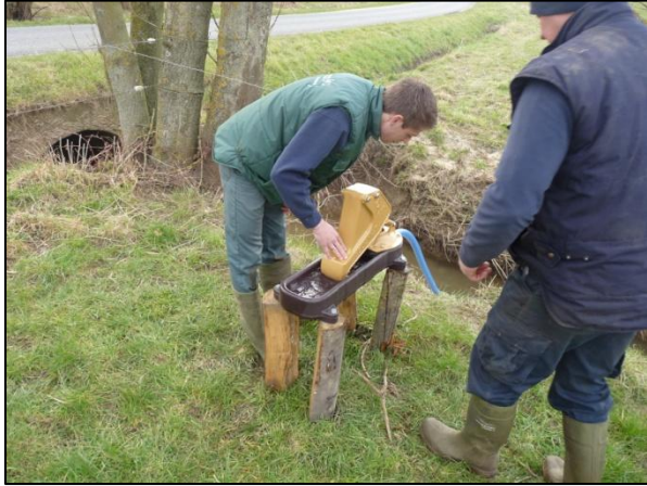
Pose de pompes à museau