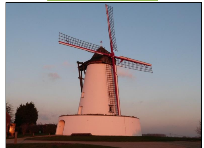
Etude sur les moulins du Pays des Collines