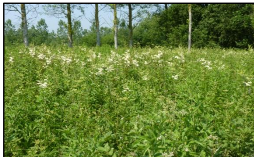
Gestion des sites naturels