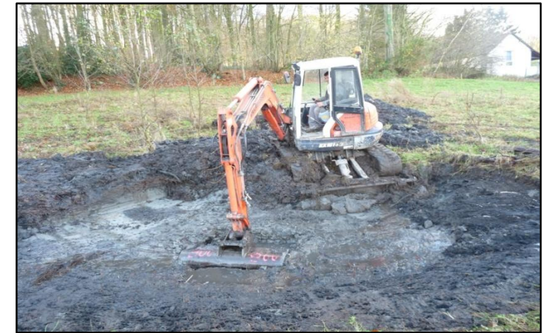
Creusement et restauration de mares