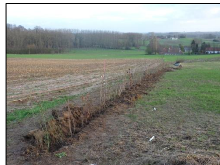
Plantation de haies, vergers et alignements d'arbres