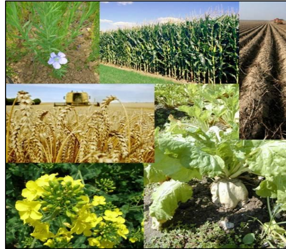
Conseils culturaux et valorisation des matières organiques