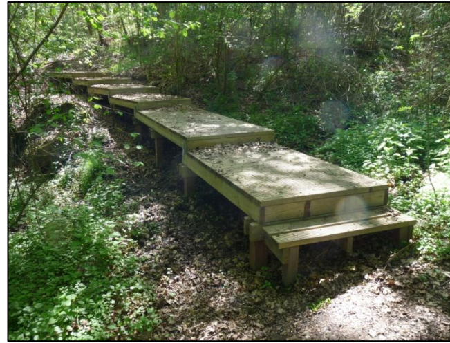
Protection des zones de sources