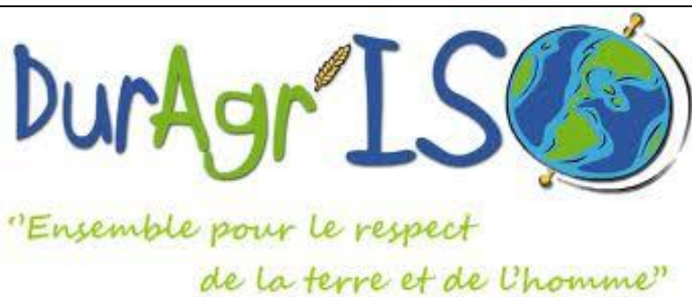
Projet Interreg DurAgrISO