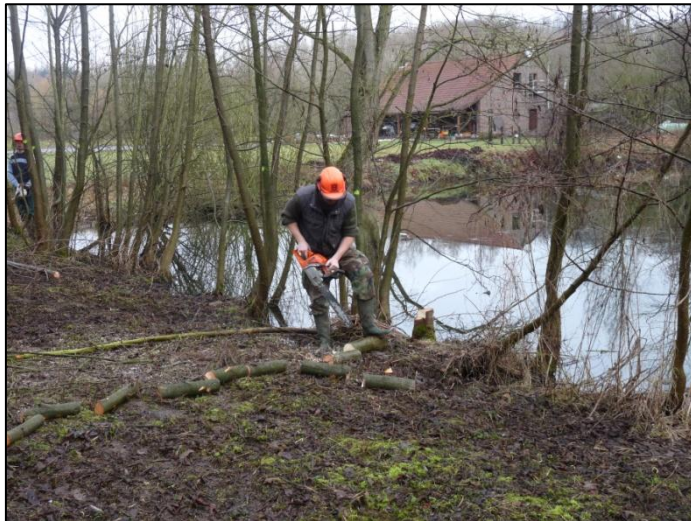
Mise en lumière de plans d'eau