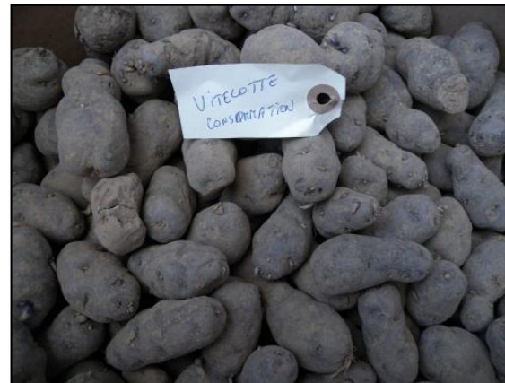
Projet Leader sur la diversification agricole au Pays des Collines