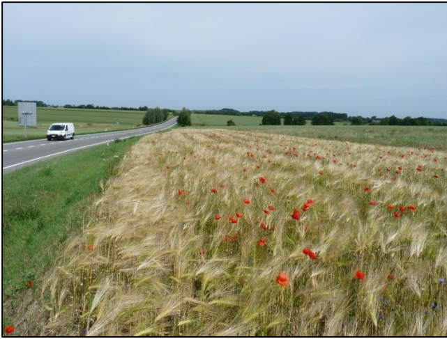
Convention Mesures Agri- Environnementales