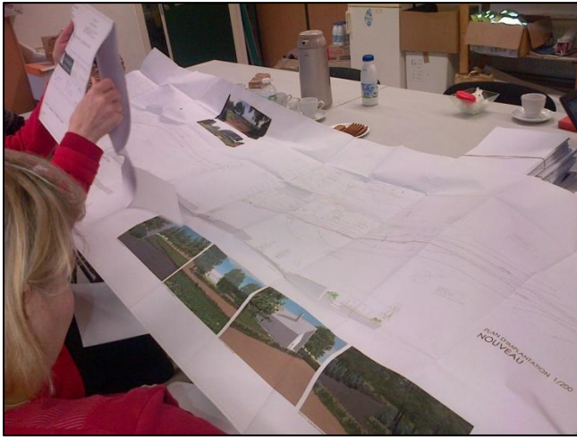
Remise d'avis sur les permis d'urbanisme et autres