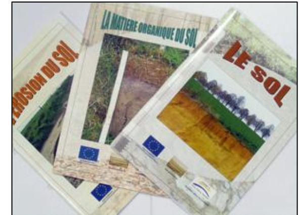
Projet Interreg Prosensols