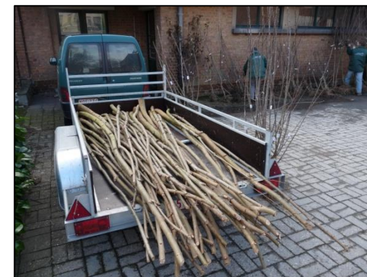
Distribution de perches de saules et de fruitiers