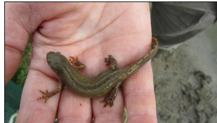
Inventaire de batraciens