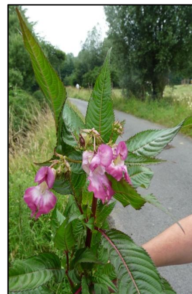
Lutte contre les plantes invasives