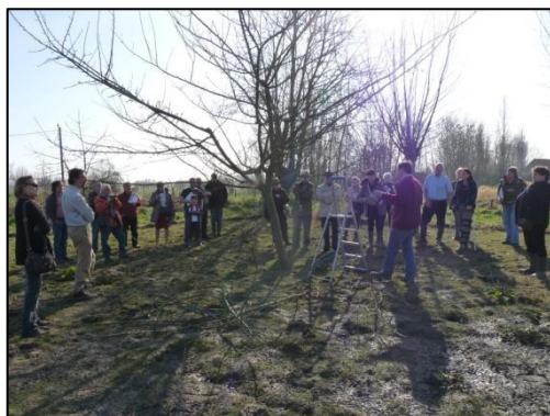
Démonstration de taille de fruitiers et de saules têtards