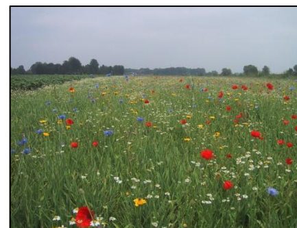
Semis de prés fleuris