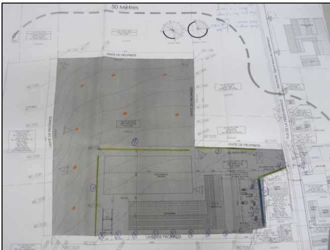
Plans d'intégration paysagère des bâtiments agricoles