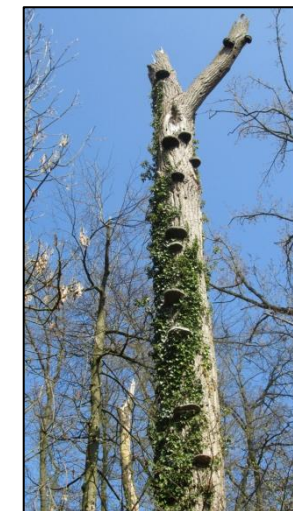
Etude du bois mort en forêt