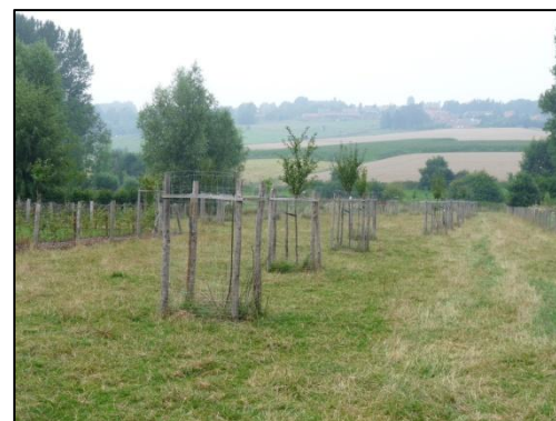
Plantation de vergers conservatoires