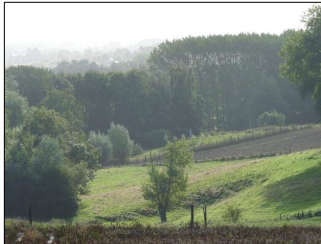
Elaboration de lignes de conduite en matière d'élevage intensif