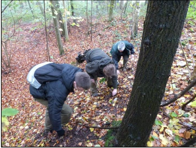
Etude sur le muscardin