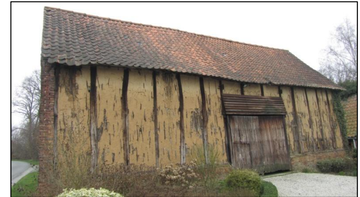
Etude et mise en valeur des maisons en torchis