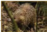
Tangue - La Réunion

Les espèces les plus connues sont le hérisson commun présent en Europe de l'Ouest et le hérisson oriental ( Erinaceus concolor ) présent en Europe de l'Est, mais il existe d'autres hérissons sur les autres continents : les hérissons d'Algérie, du désert, des steppes... chacun avec ses caractéristiques propres.